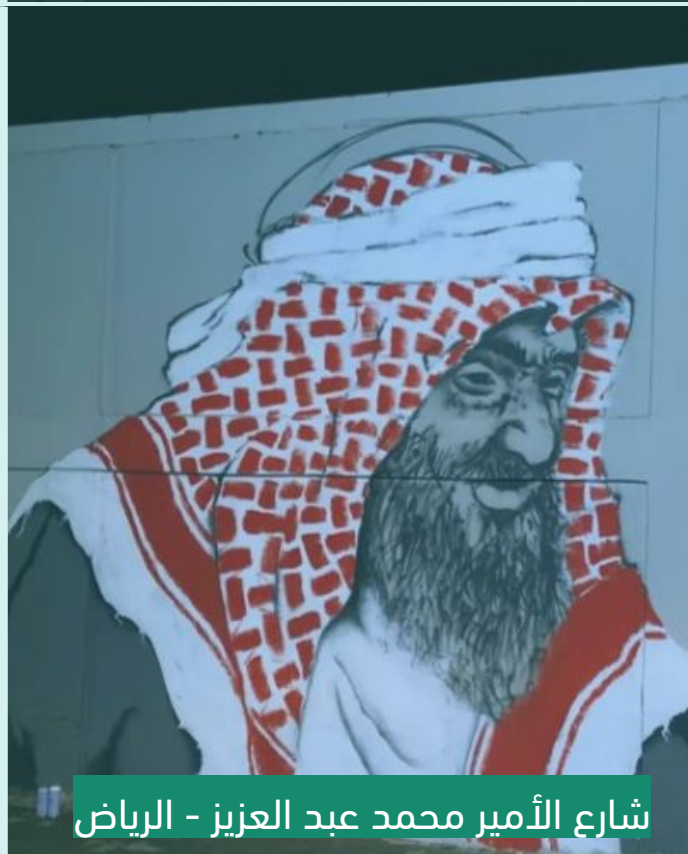
شارع الأمير محمد عبد العزيز - الرياض