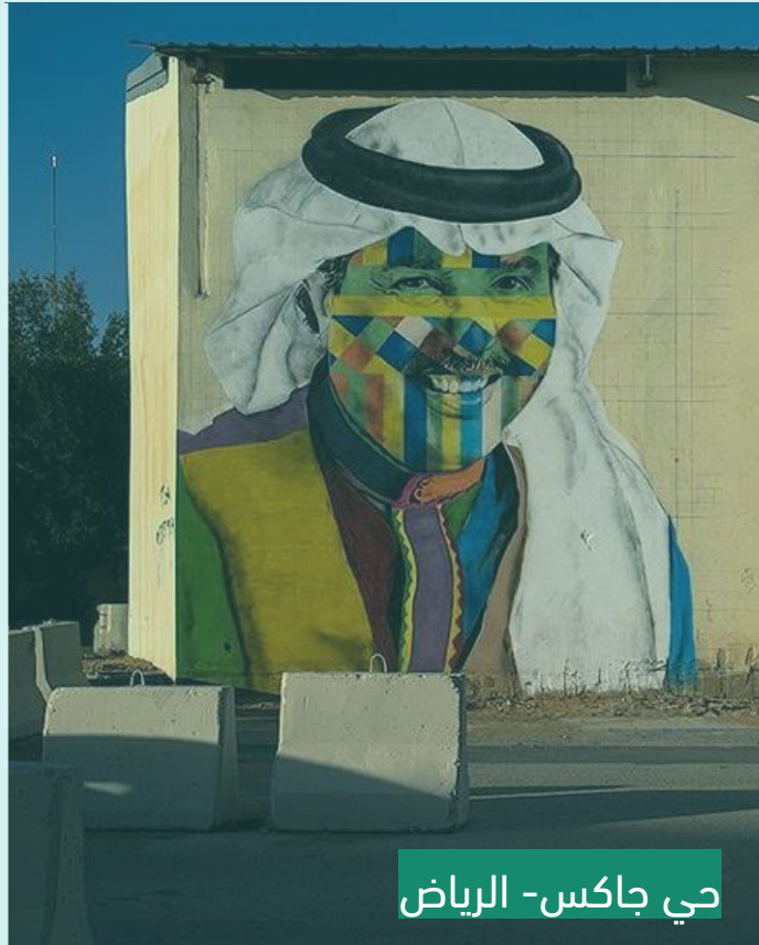
حي جاكس- الرياض