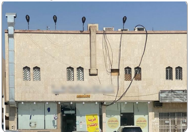
شكل (5): تمديدات كهربائية وصدية (مخالفة) في واجهة المبنى

* الصور المعروضة توضيحية ولا تتحدد شكل المخالفة بشكل خاص.