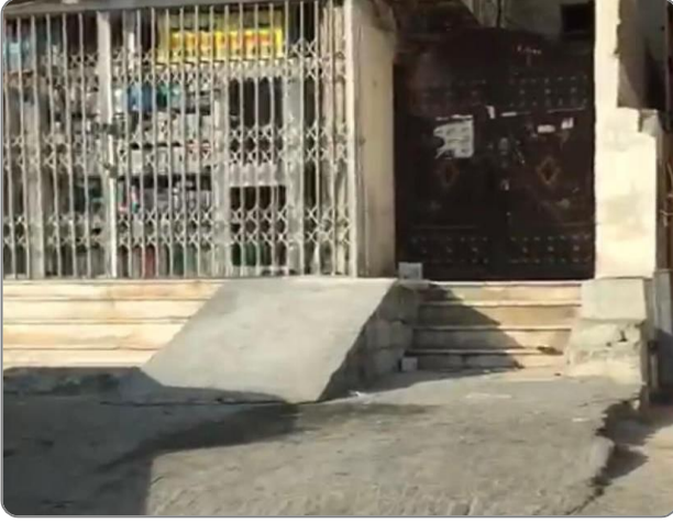
شكل (2): عدم تنفيذ ممر جانبي أمام المنحدر وفق الأدلة المعتمدة