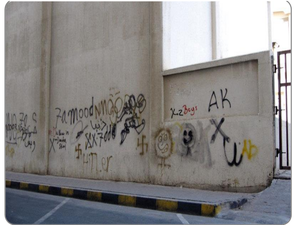
شكل (11) : وجود كتابات مشوه على الجدران

* الصور المعروضة توضيحية ولا تتحدد شكل المخالفة بشكل خاص.