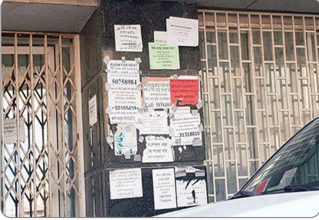
شكل (10): وجود ملصقات إعلانية قديمة أو مهالكة على واجهة المبنى