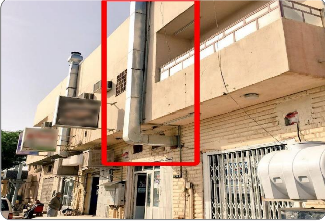
شكل (16): وضع المداخل على واجهة المبنى