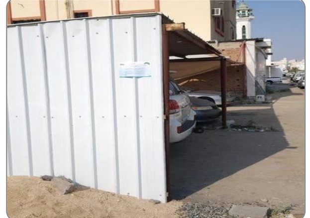
شكل (15): وجود مظلات أو هناجر خارج حد الملكية