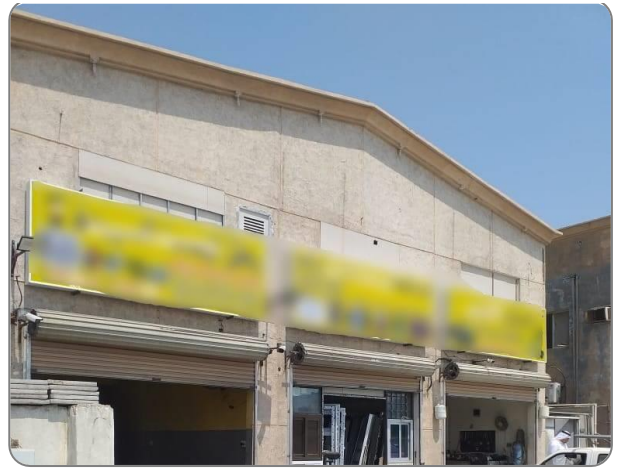
شكل (17) : عدم مطابقة اللوحات التجارية الخاصة بالمحلات للاشتراطات البلدية

* الصور المعروضة توضيحية ولا تتحدد شكل المخالفة بشكل خاص.