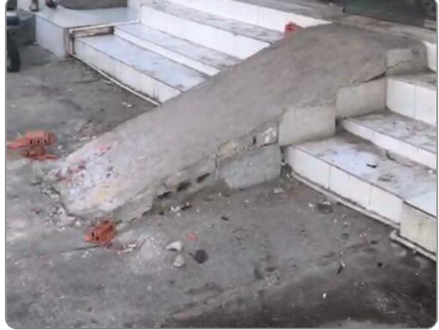
شكل (1): عدم تنفيذ منحدر للأشخاص ذوي الإعاقة وفق الأدلة المعتمدة