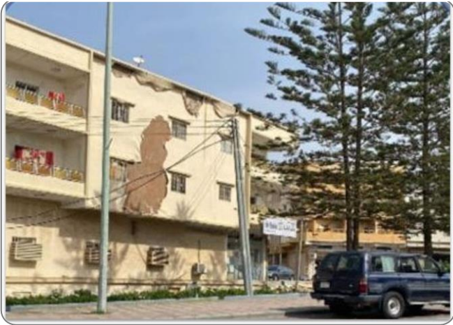
شكل (12) : تشققات على واجهة المباني