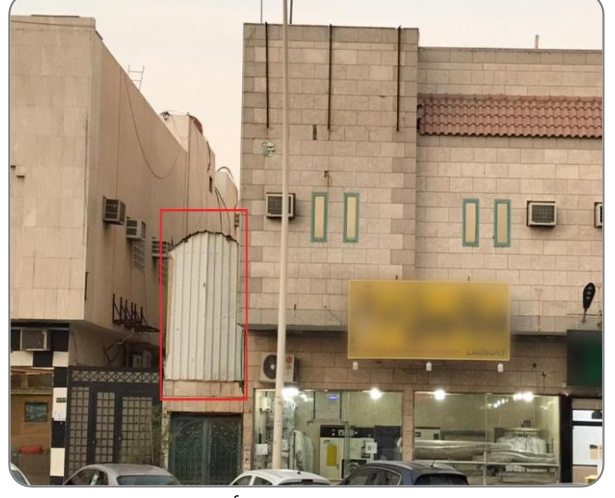
شكل (7): وجود حواجز مشوهه (أشاور حديد / شينكو) على سور الارتداد.