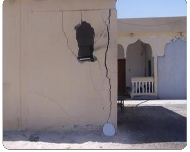
شكل (13): أسوار متهالكة أو غير مكتملة