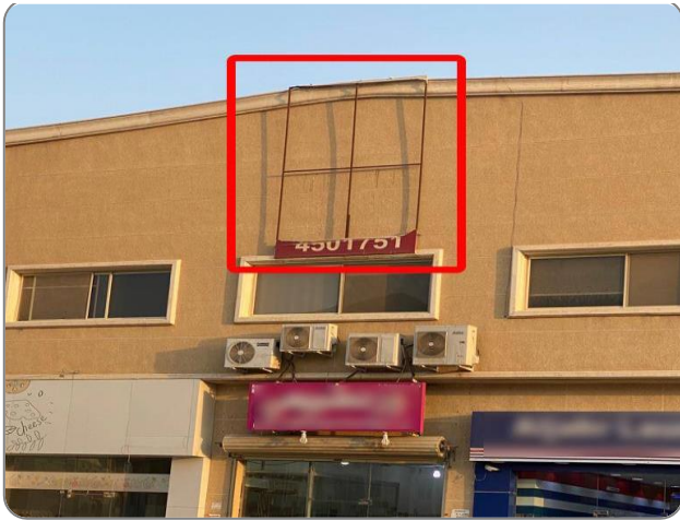
شكل (18) : وجود الأساسات الحديدية لتثبيت اللوحات المزالمة