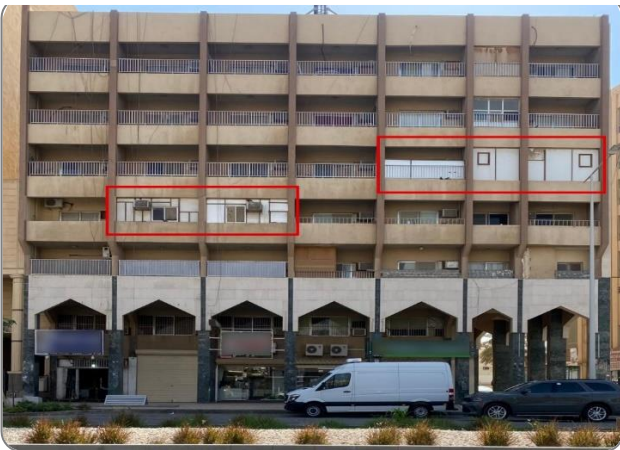
شكل (6): مخالفة تغطية الشرفات بهناجر أو مواد لا تتناسب مع شكل المبنى