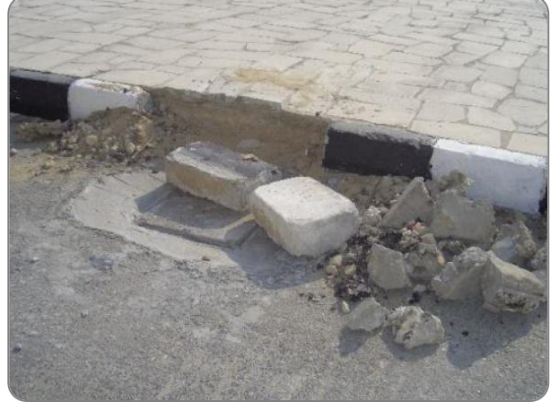
شكل (9): عدم وجود أرصفة مهالكة أو غير مكتملة جهة الشارع الرئيسي