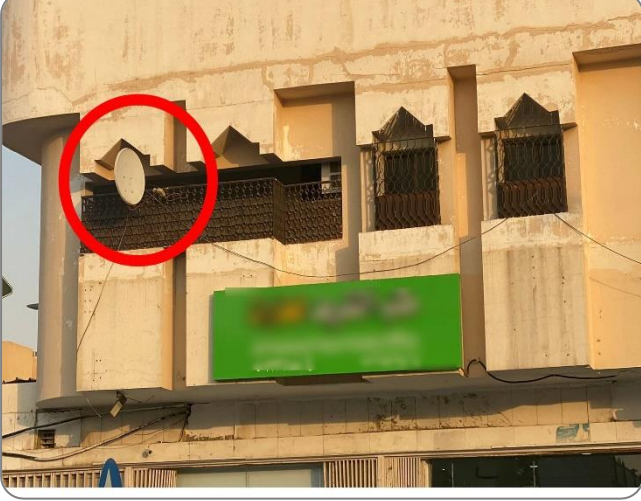
شكل (14): وجود أطباق الأقمار الصناعية على الشرفات