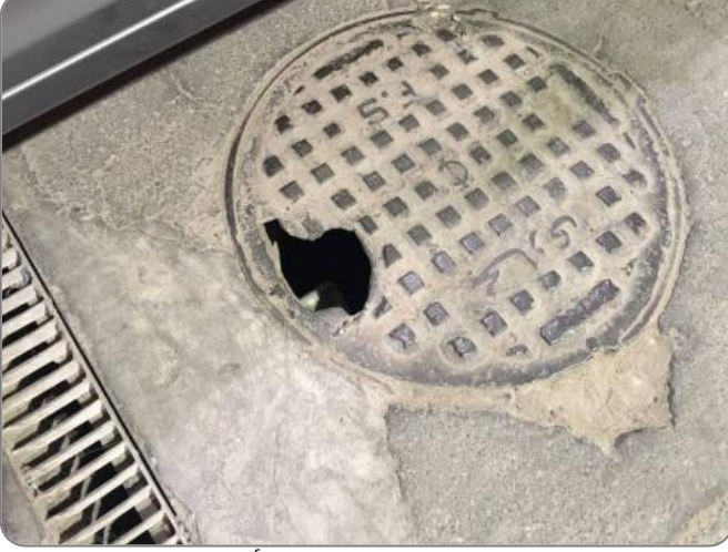
شكل (8): تغطية خزانات الصرف الصحي بأغطية غير متوافقة مع الاشتراطات البلدية