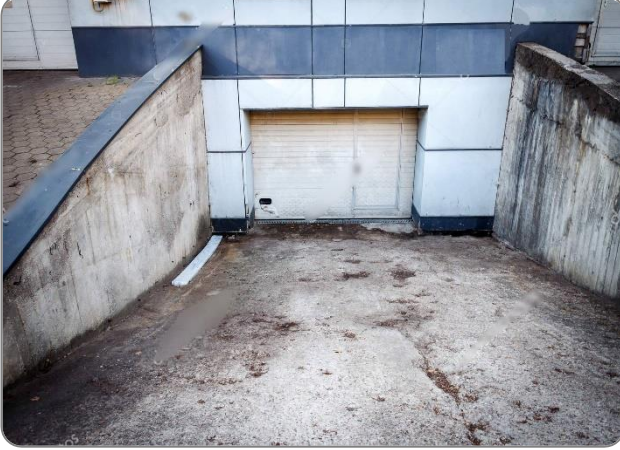
شكل (4): إغلاق مواقف القبو وتغيير إستخدامه