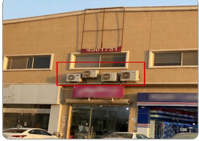
شكل (3): وحدات تكييف منفصلة (مخالفة) في واجهة المبنى أو أساسات حديدية لتثبيت لوح سابقة